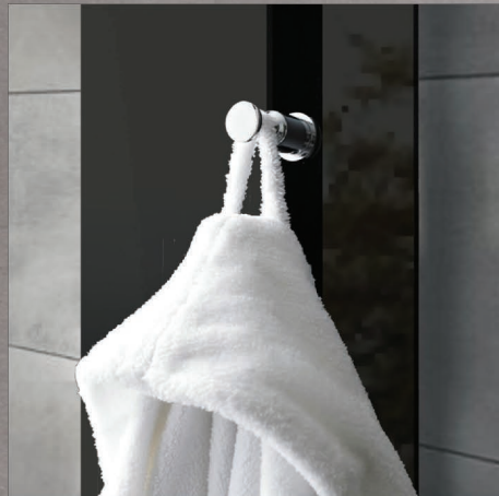
APPENDINO PORTA ASCIUGAMANI