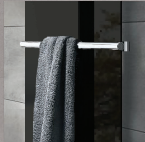
BARRA PORTA ASCIUGAMANI